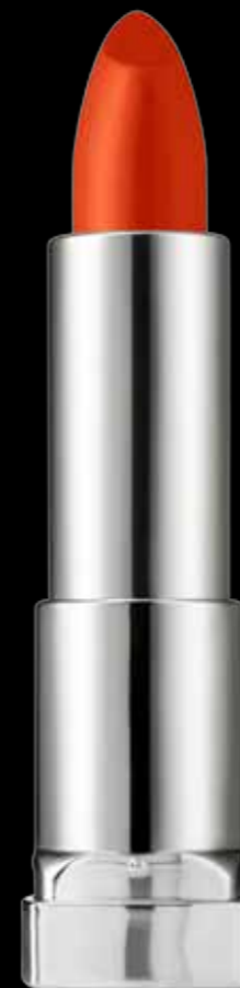
Honey nectar helps lips feel moisturized

Color Sensational Vivids ofrece un brillo audaz igual al tono del tubo. Y el color dura hasta cuatro horas, así que el labial aplicado por la mañana lucirá hermosamente vibrante a la hora del lunch. Los laboratorios incorporaron una partícula de verdadero color patentada que envuelve los pigmentos de alta intensidad alrededor de un mineral especial. Cuando el color es aplicado a los labios, la innovadora partícula se fija encima de la piel para una cobertura súper saturada y la más poderosa recompensa de color. La cremosa fórmula se pega a las curvas, haciendo que los labios luzcan más completos. También contiene néctar de miel que junto con otros agentes humectantes, ayudan a hidratar los labios y reduce la apariencia de líneas finas. El néctar de miel ayuda a los labios a sentirse hidratados. Los clásicos pigmentos ofrecen un resultado de bajo color opaco. Los pigmentos Vivids son más intensos, dándole a los labios una explosión de verdadero color.