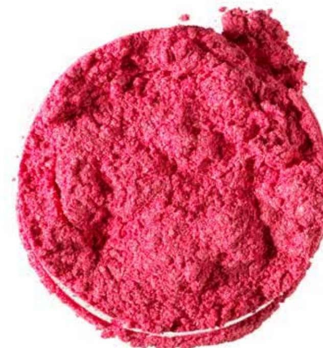
Vivids pigments are more intense, giving lips a pop of true color

Color Sensational Vivids ofrece los más vibrantes colores jamás vistos.