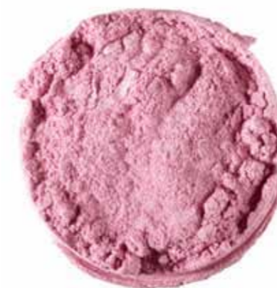
Classic pigments offer a dull, low-color result